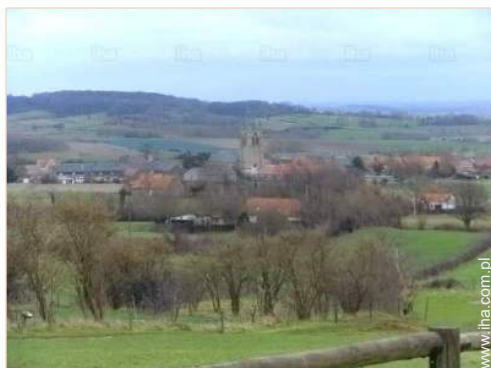
widok na wieś