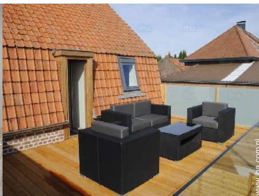
taras na dachu