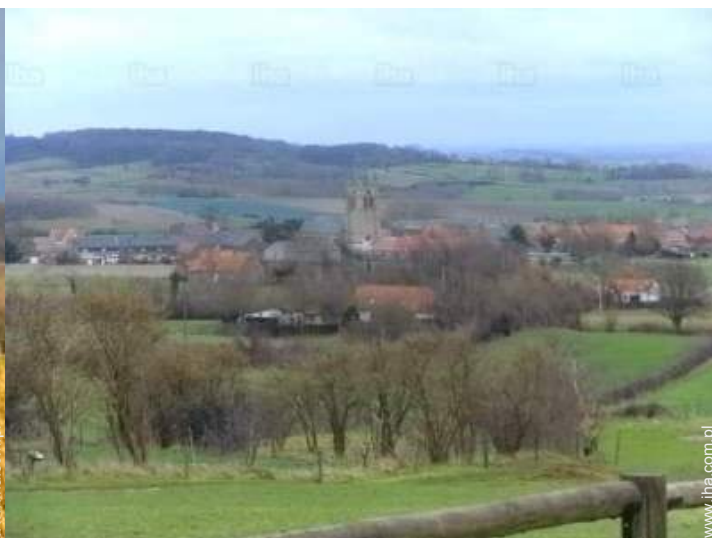
widok na wieś