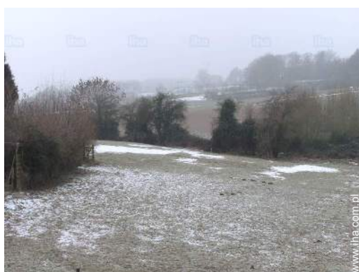
widok z pokoju