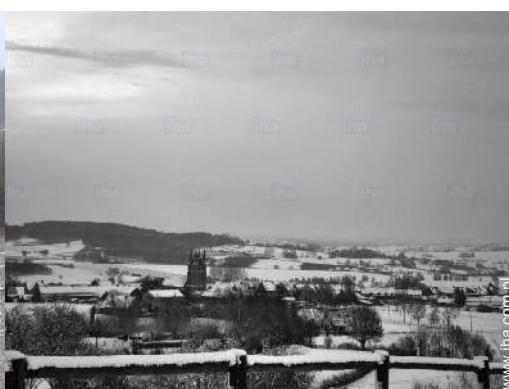
widok na centrum wsi