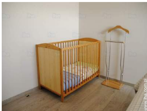
Udogodnienia dla niemowląt