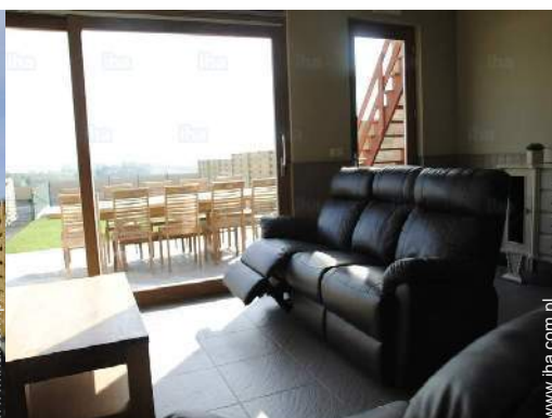
widok z domu