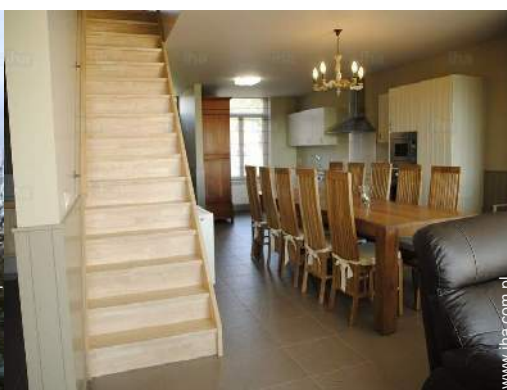
Układ wewnętrzny i udogodnienia