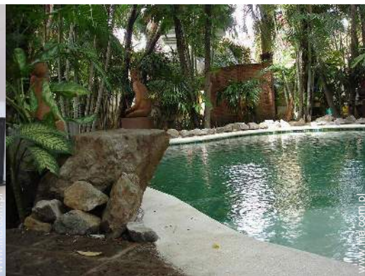
widok na basen