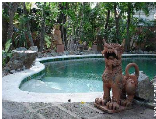
widok na basen