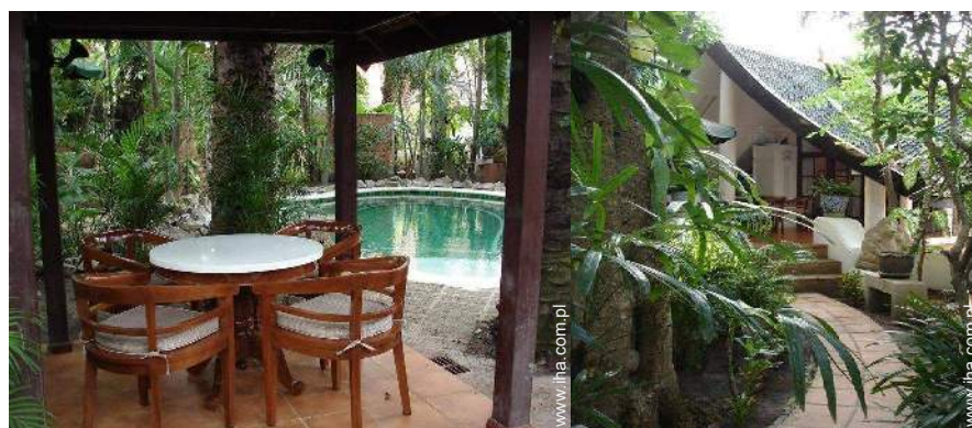
widok na basen