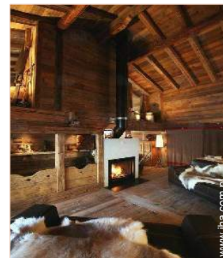
kącik przy ognisku