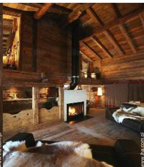
kącik przy ognisku