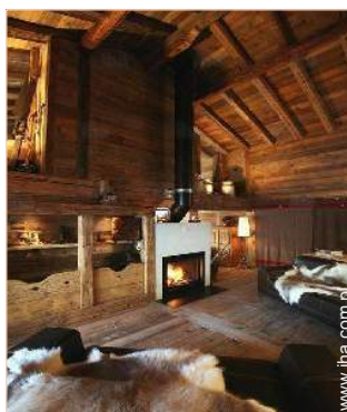
kącik przy ognisku

Przyjmujemy zwierząt domowych pod pewnymi warunkami (zapytać u właściciela) Wynajem dla niepalących, zasięg telefonów komórkowych, transport własny wskazany Woda : gorąca/zimna Napięcie elektryczne : 220W / 60Hz Prąd elektryczny : sieć elektryczna