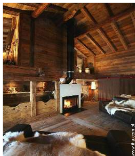
kąciak przy ognisku