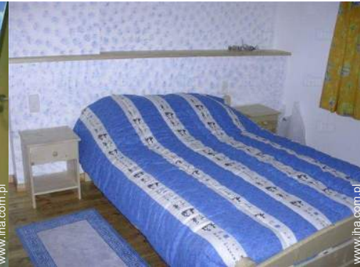
widok z pokoju