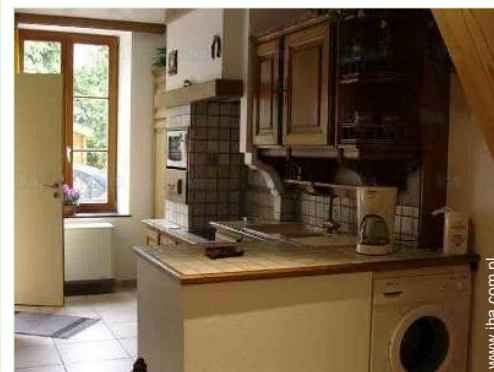
Wyposażenie jest do Państwa dyspozycji

Centrum wsi 200m Przystanek autobusowy 200m Wynajem roweru (górnego) Piekarnia Szynek Magazyny lokalne Supermarket Fryzjer Pocztę Lekarz