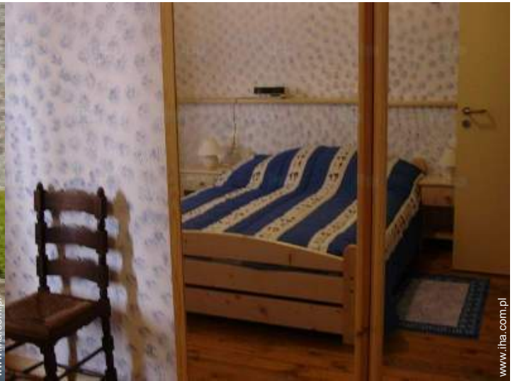
Pościel - łózko(a)