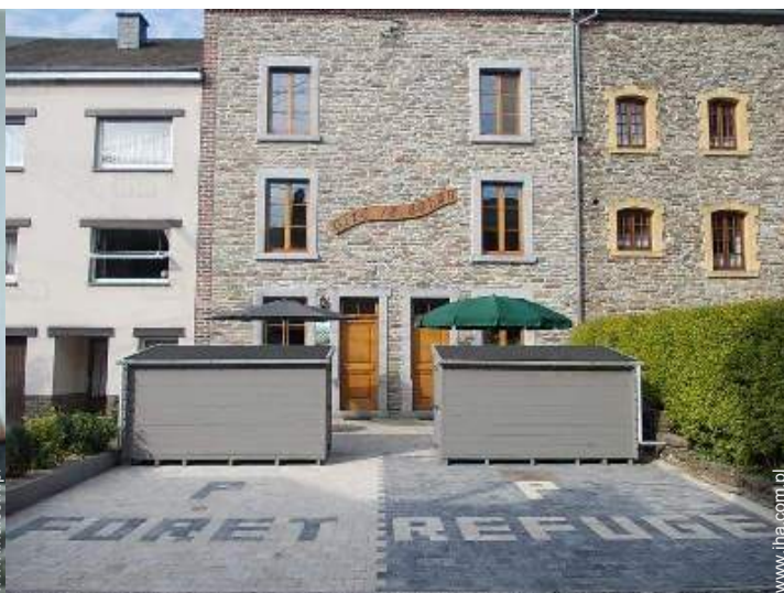
Środowisko do dyspozycji gości