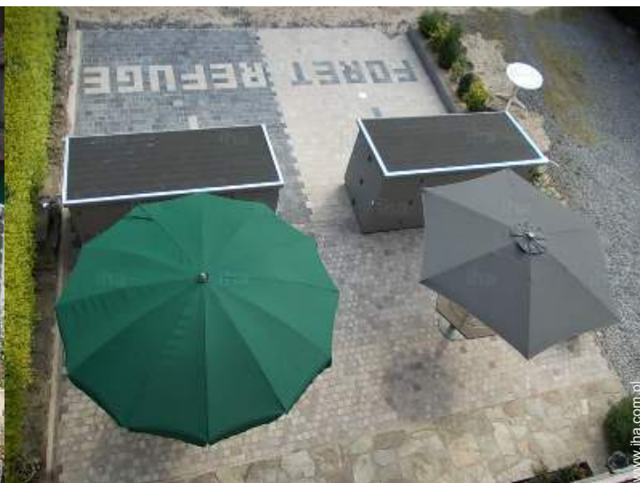
Urządzenia dostępne dla gości zewnętrzne