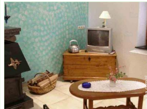
widok z salonu