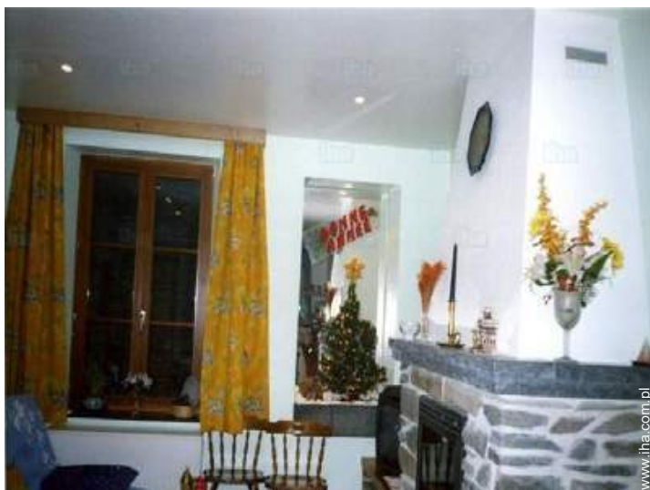
piec opalany drewnem