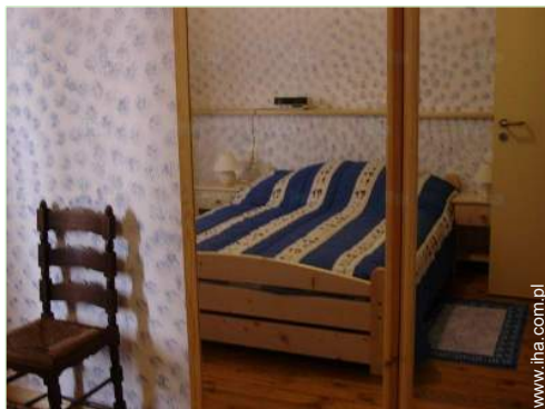
Pościel - łóżko(a)