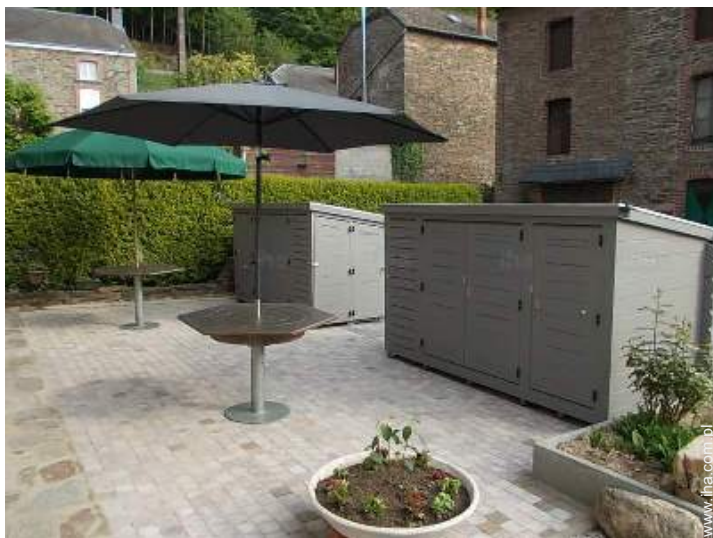
Wyposażenie zewnętrzne do dyspozycji gości