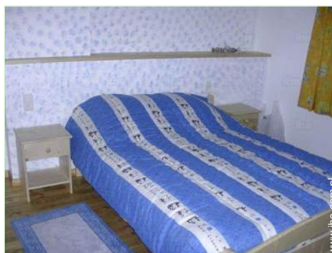
widok z pokoju