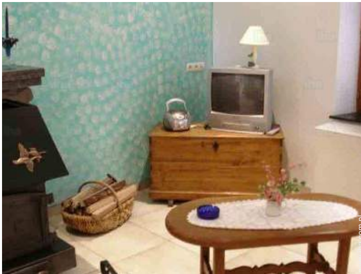
widok z salonu