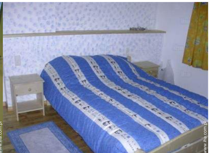
widok z pokoju