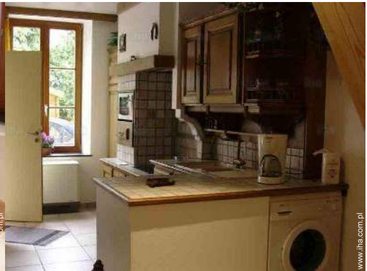
Wyposażenie jest do Państwa dyspozycji