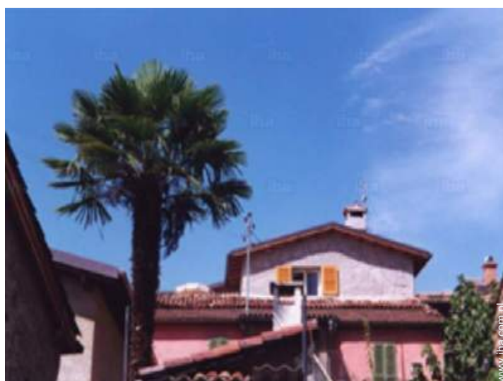
Czarowny Dom Kamienny