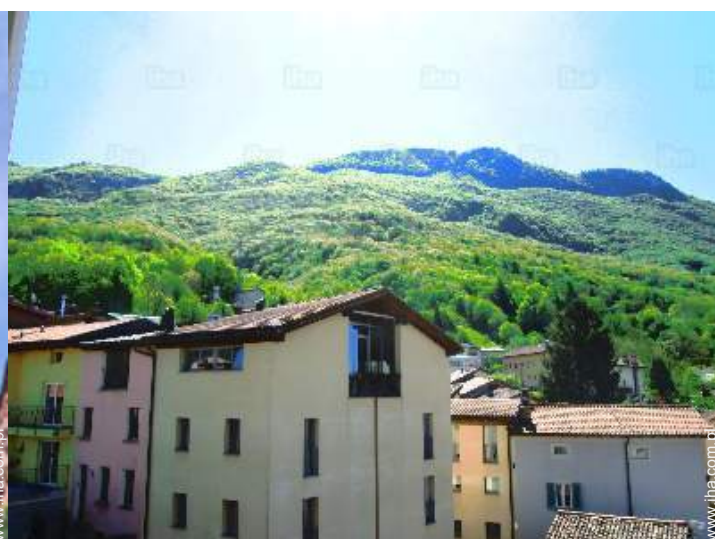
widok od południowego wschodu