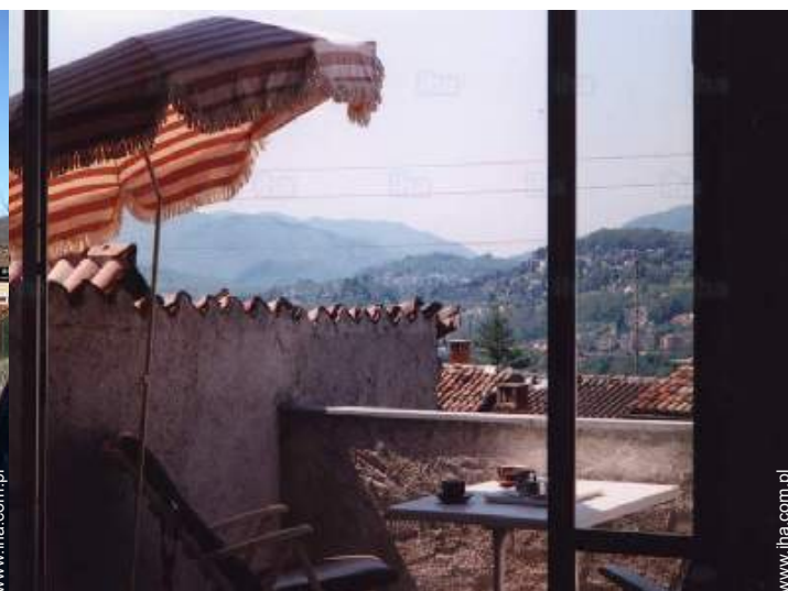
widok od południowego zachodu