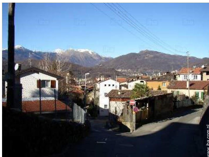
widok na wieś