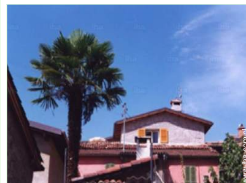
Czarowny Dom Kamienny