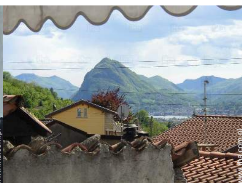
widok na jezioro