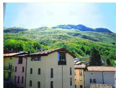
widok od południowego wschodu

Przystanek autobusowy 200m Wynajem okrętów 5km Wypożyczalnia nart 20km Wynajem pościeli / pralnia 3km Piekarnia 100m Szynkarz 100m Magazyny lokalne 100m Supermarket 1,5km Sklepy luksusowe 4km Fryzjer 3km Kafejka internetowa 5km Pocztą 100m Bank <50m Bankomat 1km Apteka 500m Lekarz 500m Szpital 5km Ambulatorium 5km