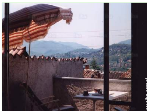
widok od południowego zachodu

Dostosowanie dla osób niepełnosprawnych : na ucho