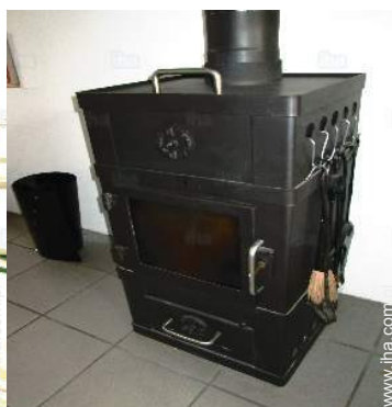
piec opalany drewnem