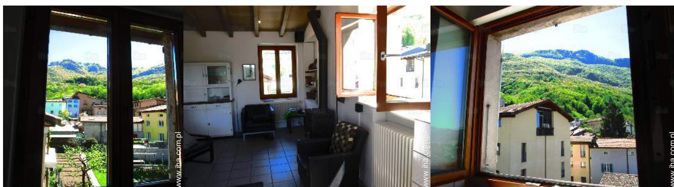
widok od północnego wschodu