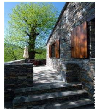
widok z tarasu