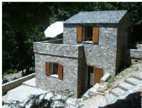
widok na góry