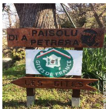
Obecność na miejscu