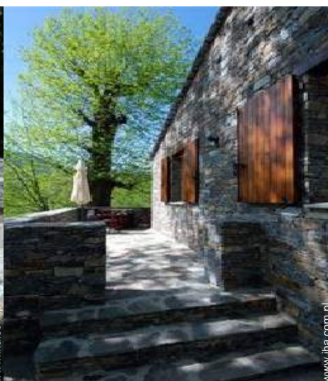
widok z tarasu