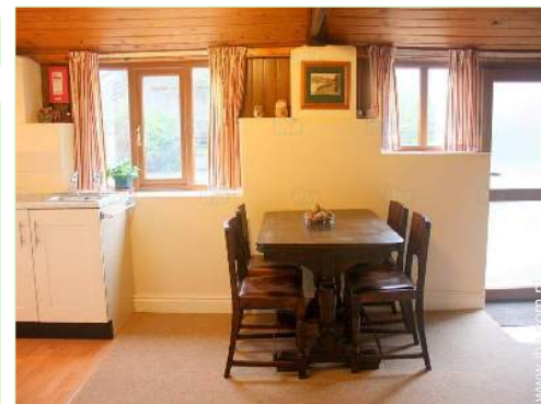
kącik do jedzenia

Grill, Stół(y) ogrodowy(e), krzesło(a) ogrodowe