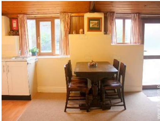
kąciok do jedzenia