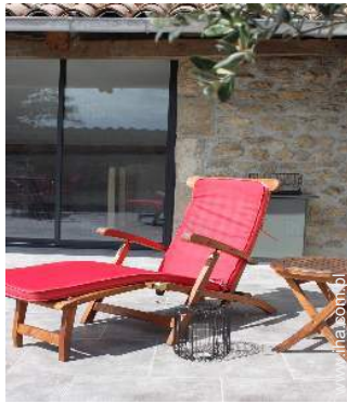
Zainstalowane na zewnątrz obiekty