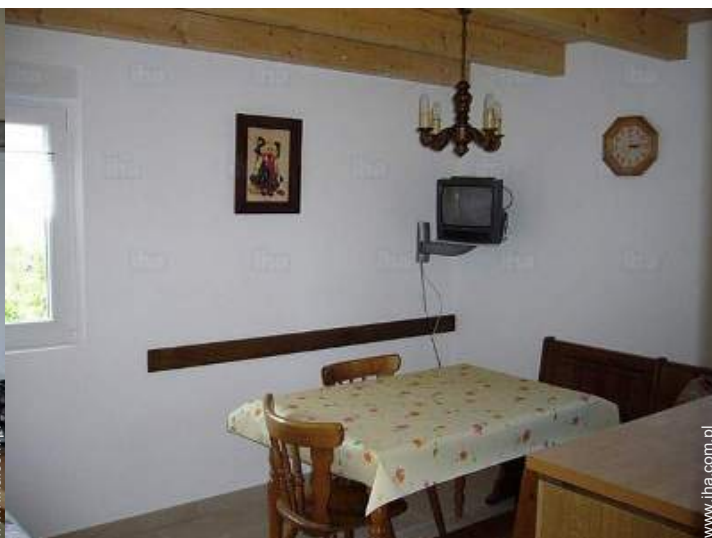
kącik do jedzenia