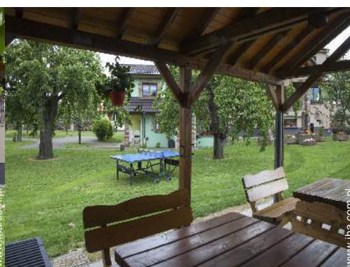
widok z ogrodu / parku