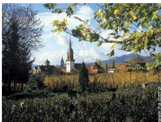
widok na wieś