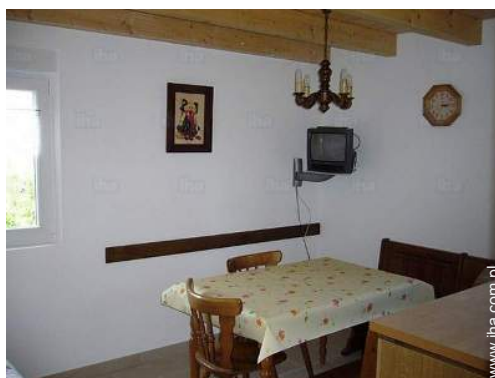
kąciok do jedzenia