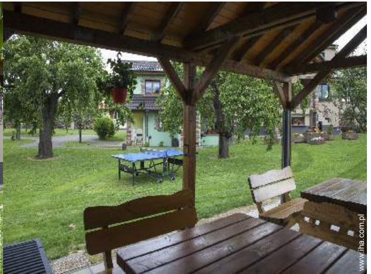
widok z ogrodu / parku