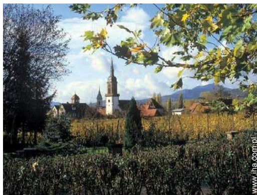
widok na wieś