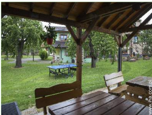
widok z ogrodu / parku