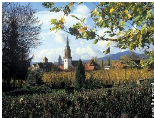
widok na wieś