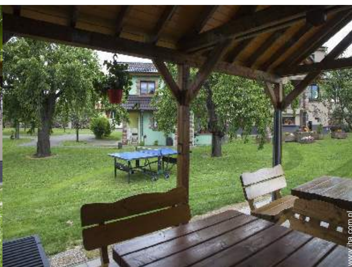
widok z ogrodu / parku