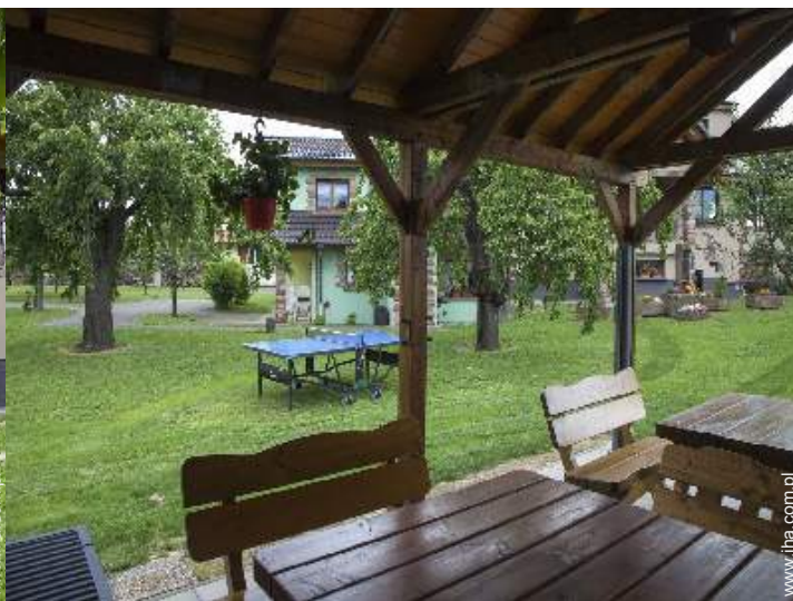
widok z ogrodu / parku