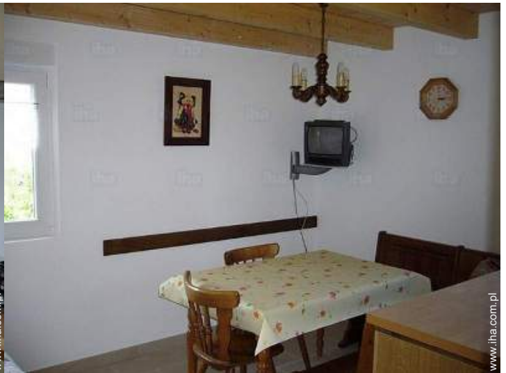
kąciok do jedzenia