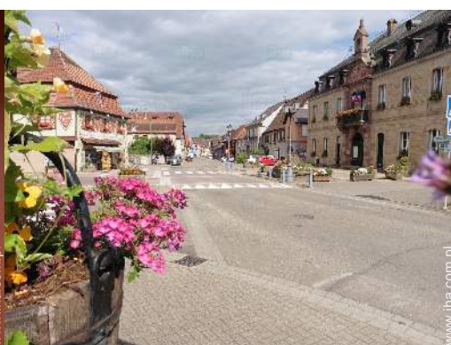
widok na wieś