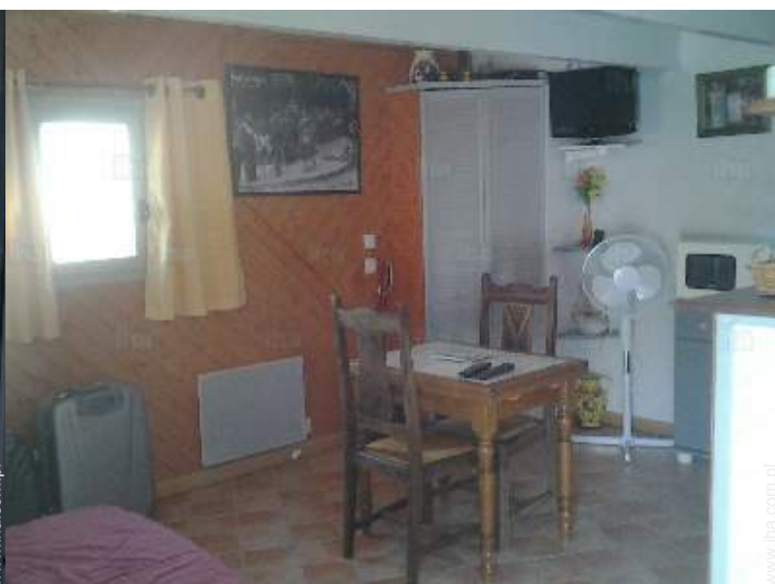
Układ wewnętrzny i udogodnienia