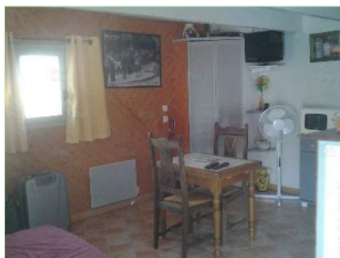
Układ wewnętrzny i udogodnienia