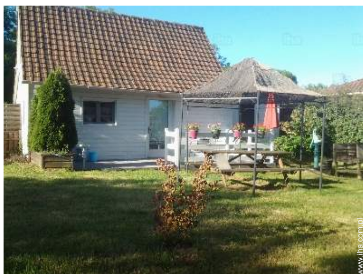
widok z tarasu