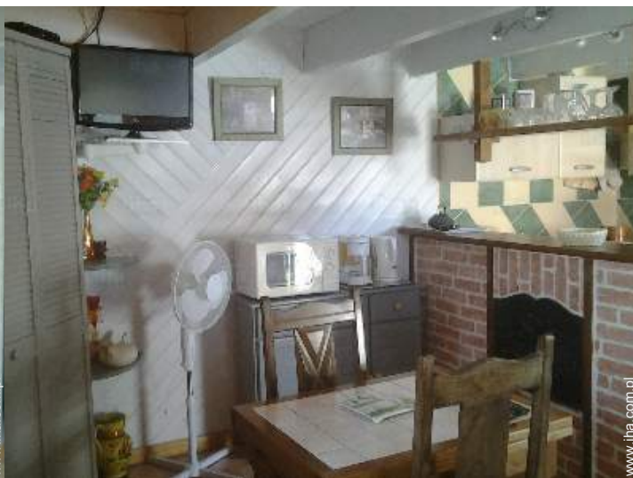
kącik do jedzenia