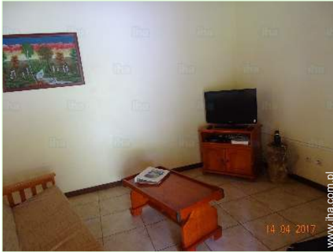
pokój z TV