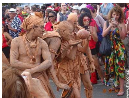
W wolnym czasie