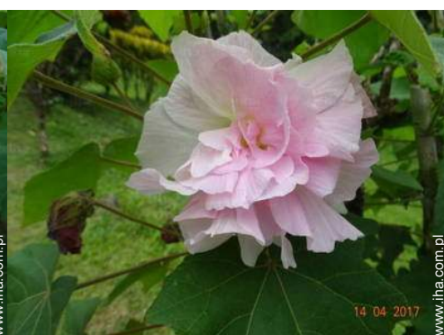
widok z zadaszonego tarasu