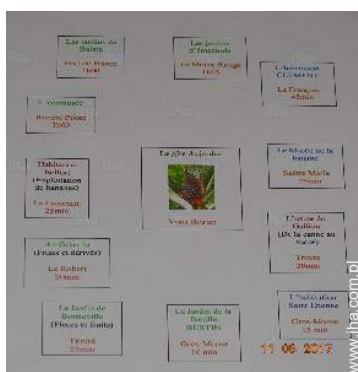
park i ogród