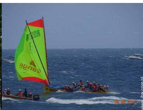
W wolnym czasie