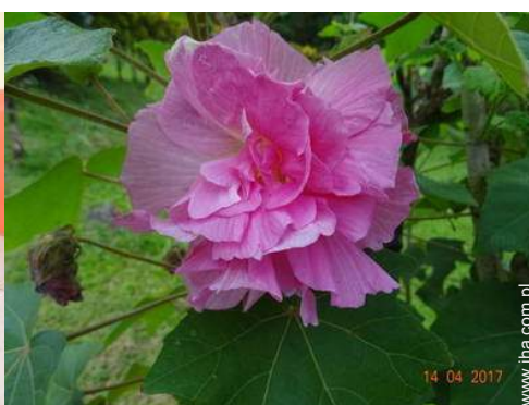
widok z zadaszonego tarasu