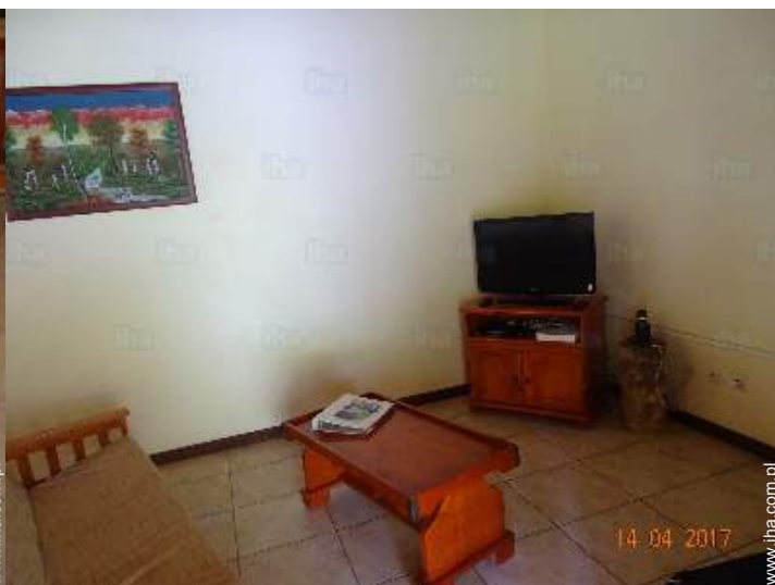
pokój z TV