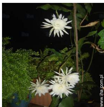
widok z zadaszonego tarasu