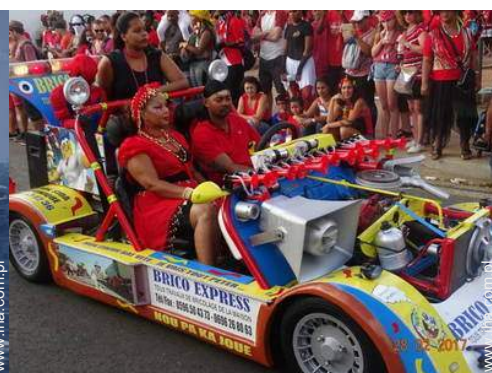
W wolnym czasie