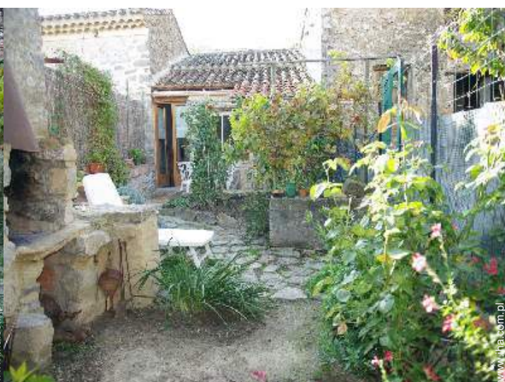
Urządzenia dostępne dla gości zewnętrzne