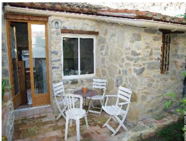
Środowisko do dyspozycji gości