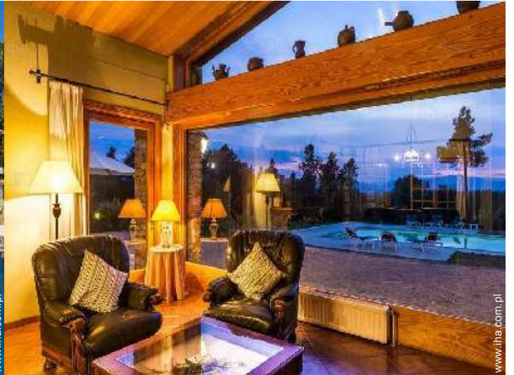
widok z salonu