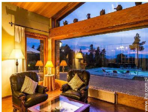
widok z salonu