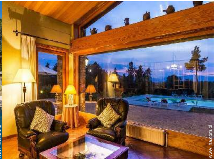
widok z salonu