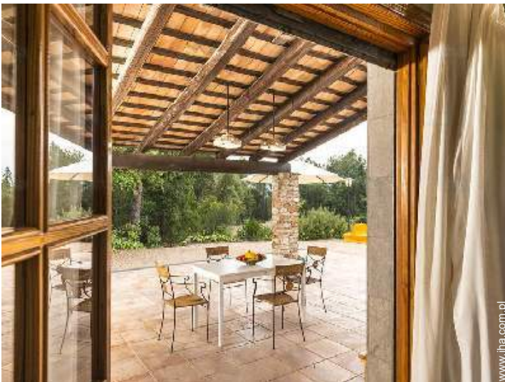
Środowisko do dyspozycji gości