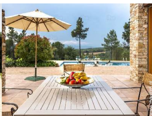
widok z jadalni