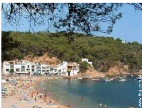
Miasta w pobliżu