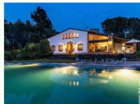
widok z ogrodu / parku