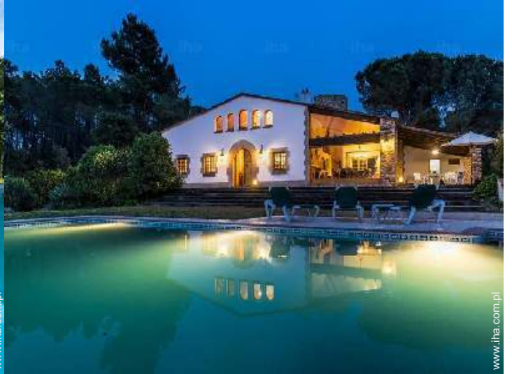
widok z ogrodu / parku