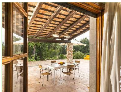
Środowisko do dyspozycji gości