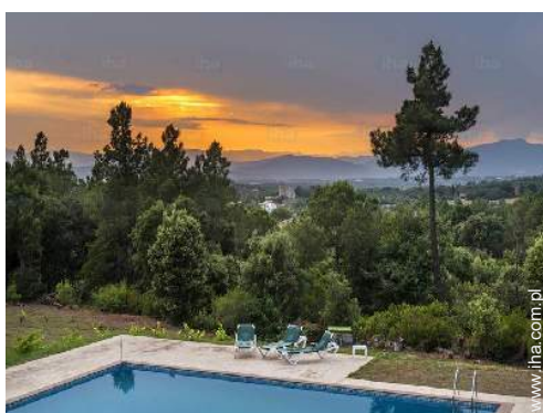
widok z pokoju