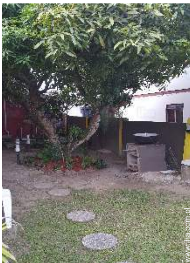
widok z ogrodu / parku