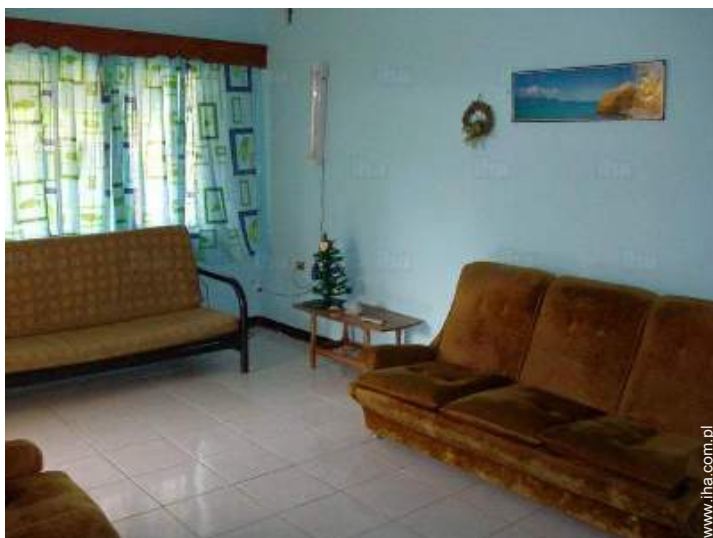
Komfort przeznaczony dla gości