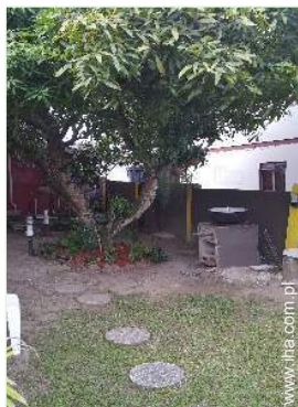
widok z ogrodu / parku