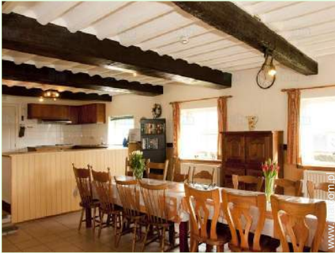
kącik do jedzenia