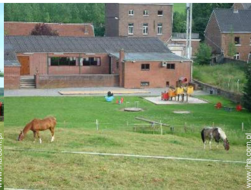
widok z ogrodu / parku