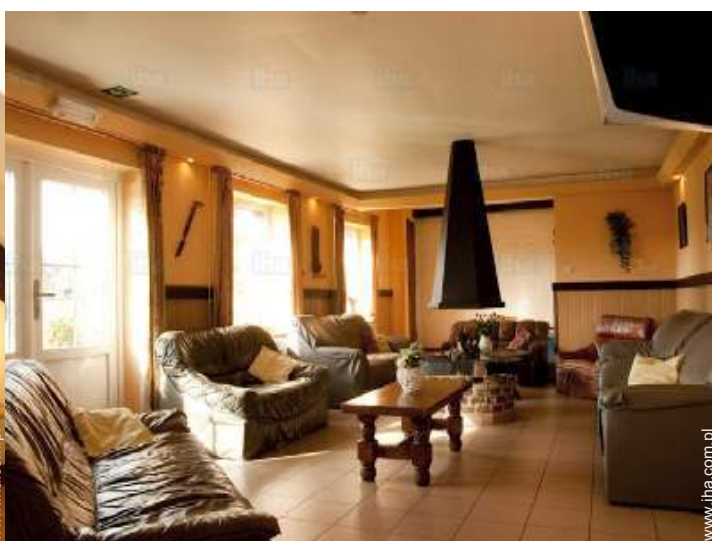
widok z salonu