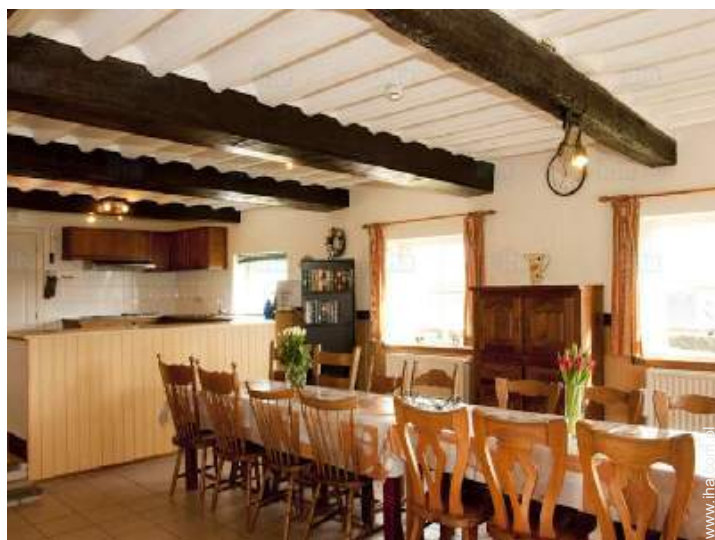
kąciok do jedzenia