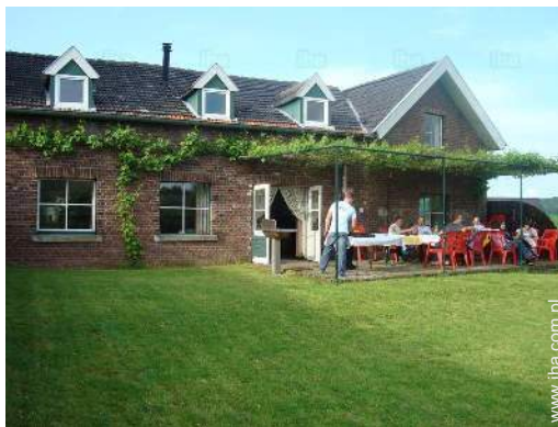
widok z tarasu