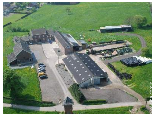
widok z lotu ptaka