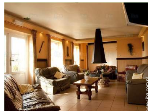
widok z salonu

Centrum wsi 500m Śródmieście 3km Przystanek autobusowy 300m Piekarnia 4km Magazyny lokalne 4km Supermarket 4km Fryzjer 3km Poczta 3km Bank 4km Bankomat 4km Apteka 4km Lekarz 4km Szpital 15km