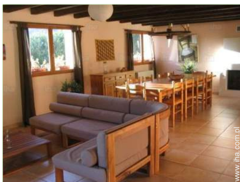
Układ wewnętrzny i udogodnienia