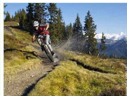
rozrywka letnia w pobliżu