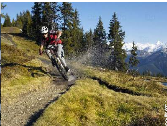
rozrywka letnia w pobliżu