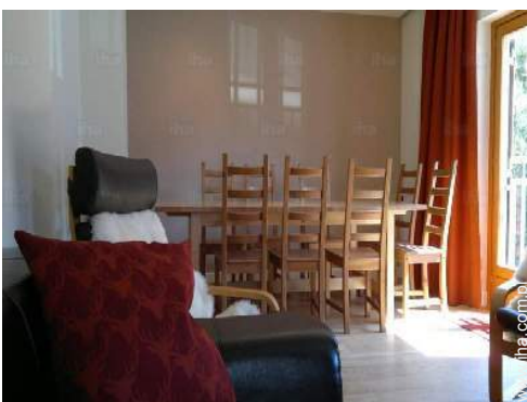
kąciok do jedzenia