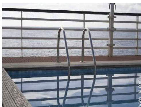
widok z basenu