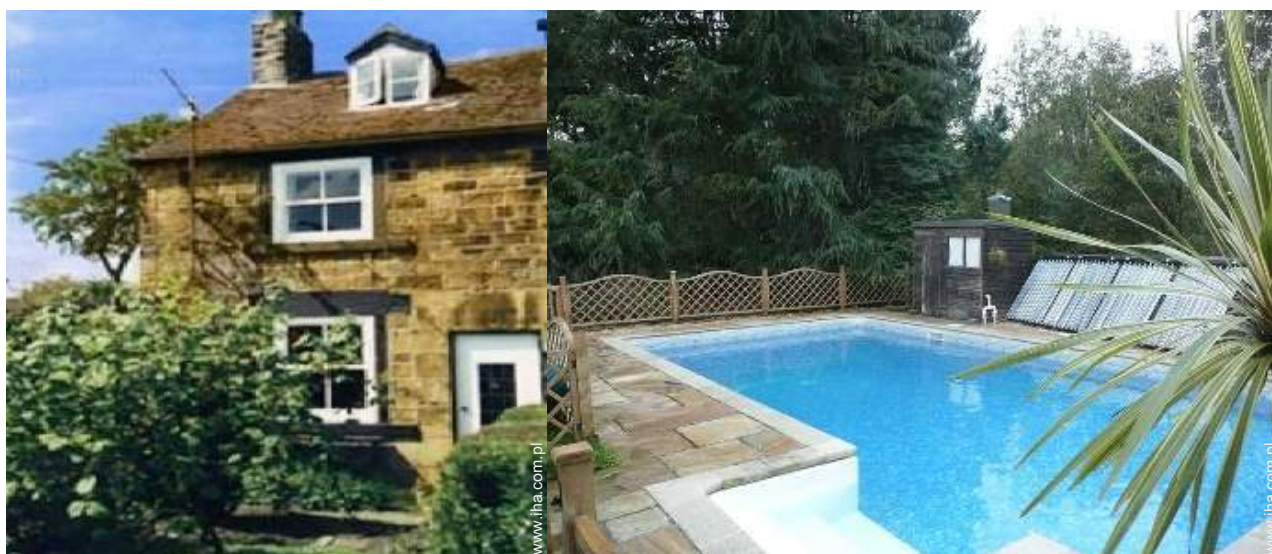
widok na basen