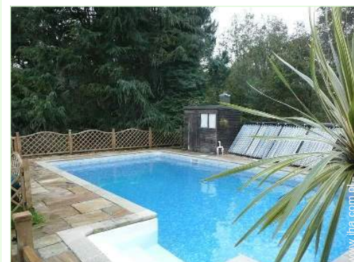
widok na basen