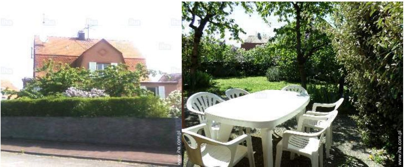
widok na ogród / park