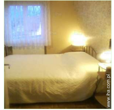
dwa pojedyncze łóżka