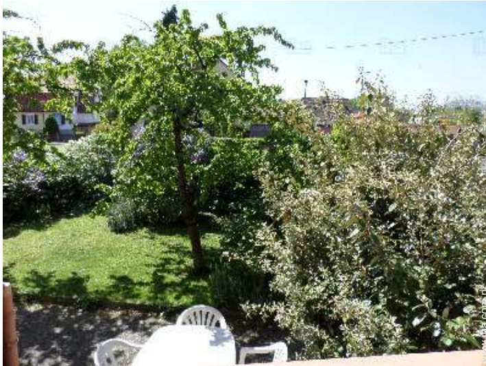
widok z domu