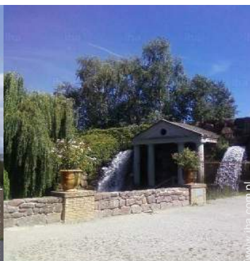
Rozrywka i odpoczynek