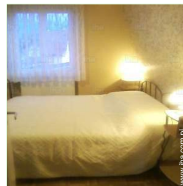
dwa pojedyncze łóżka

Salon letni, grill, Stół(y) ogrodowy(e), 8 krzesło(a) ogrodowe, kącik ogrodowy