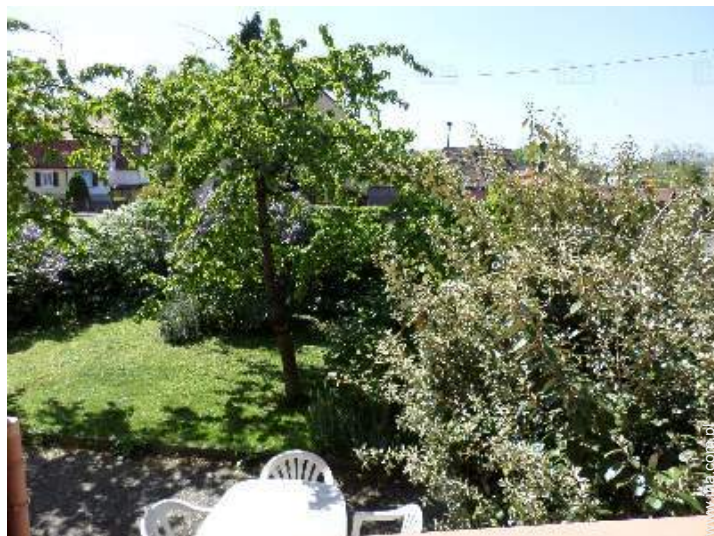
widok z domu