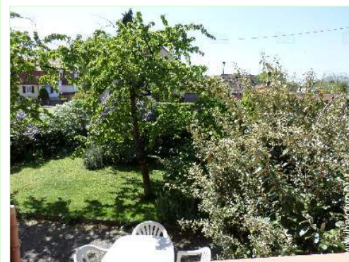
widok z domu