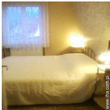
dwa pojedyncze łóżka