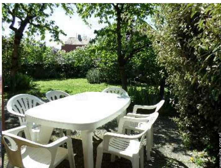
widok na ogród / park