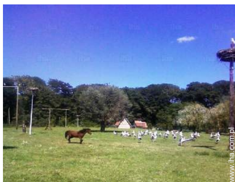
park i ogród