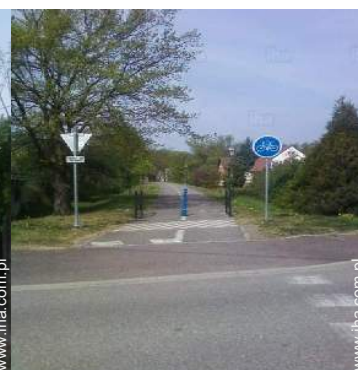
tor roweru górskiego