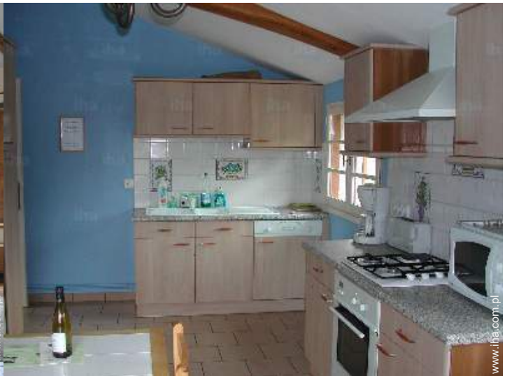
widok z kuchni