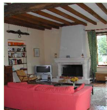
widok z pokoju wspólnego