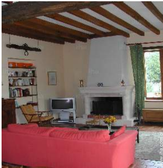
widok z pokoju wspólnego