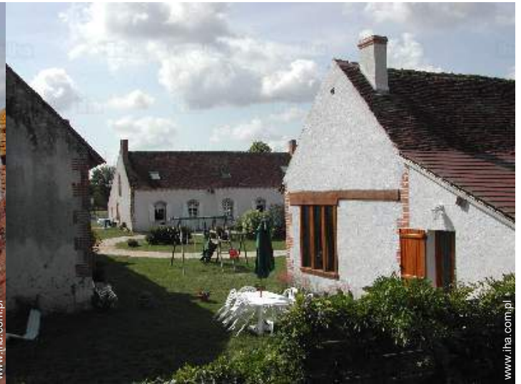
widok z ogrodu / parku