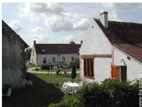
widok z ogrodu / parku

Krzesełko dla dziecka, stół do przewijania, nocniczek