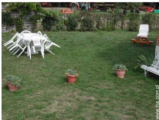
Wyposażenie jest do Państwa dyspozycji