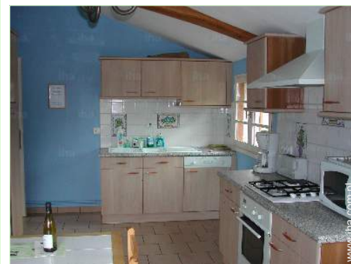
widok z kuchni

Centrum wsi 5km Śródmieście 10km Wynajem roweru (górnego) 10km Wynajem motocykli/skuterów 10km Wynajem samochodów 10km Piekarnia 10km Szykarnia 10km Magazyny lokalne 7,5km Supermarket 10km Sklepy luksusowe 10km Fryzjer 10km Kafejka internetowa 10km Poczta 10km Bank 10km Bankomat 10km Apteka 10km Lekarz 10km Pielęgniarka 10km Szpital 10km