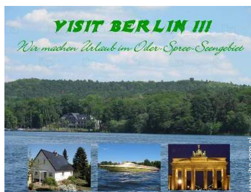
W wolnym czasie