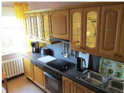
oddzielna duża kuchnia

Dostosowanie dla osób niepełnosprawnych : z uszkodzeniem aparatu ruchu, na oko, na ucho, psychicznie chorzy