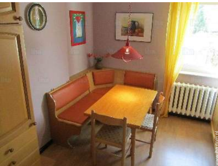
kącik do jedzenia