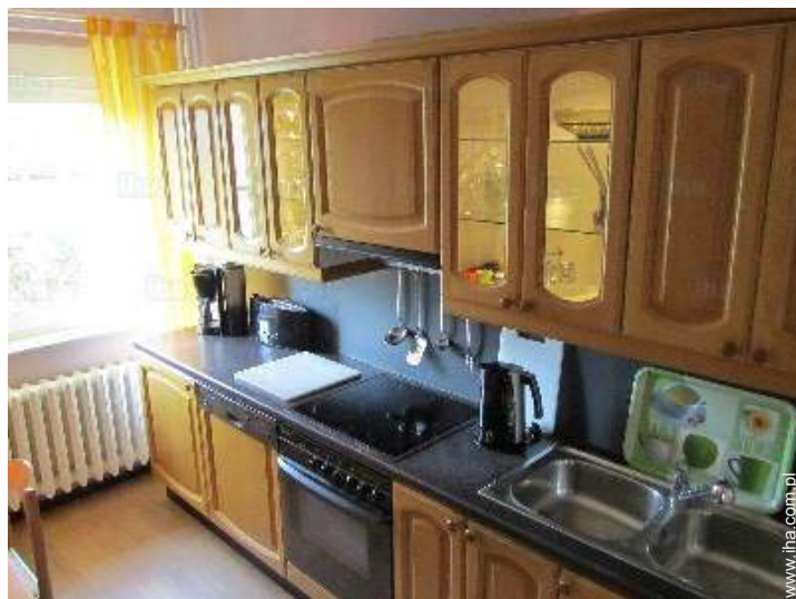
oddzielna duża kuchnia