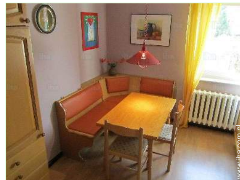
kącik do jedzenia

Grill, Stół(y) ogrodowy(e), 5 krzesło(a) ogrodowe, parasol, 4 transatlantycki(e) leżak(i)