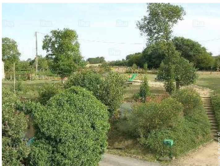
widok na ogród / park