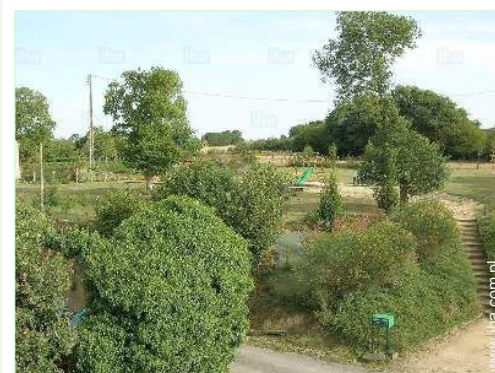
widok na ogród / park

Centrum wsi 4km Śródmieście 4km Piekarnia 4km Szynkarz 5km Magazyny lokalne 5km Supermarket 5km Sklepy luksusowe 15km Fryzjer 5km Kafejka internetowa 5km Poczta 5km Bank 5km Bankomat 5km Apteka 5km Lekarz 5km Pielęgniarka 5km Szpital 15km