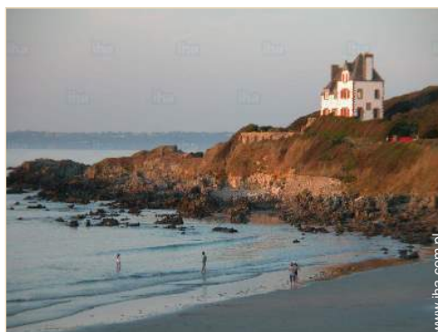
bezpośredni dostęp do plaży