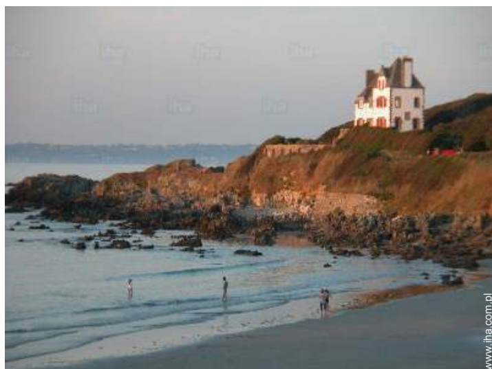
bezpośredni dostęp do plaży