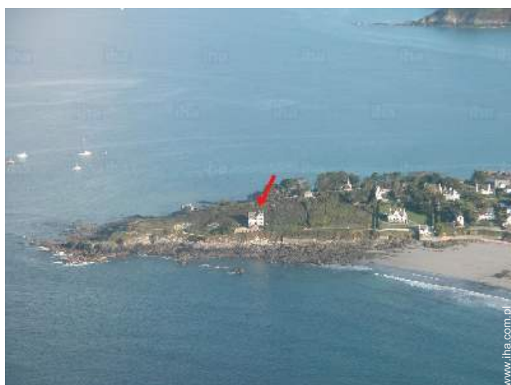
widok z lotu ptaka