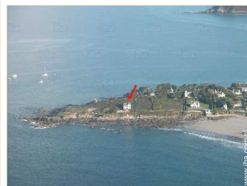
widok z lotu ptaka

Centrum wsi 500m Przystanek autobusowy 300m Wynajem samochodów 20km Piekarnia 300m Magazyny lokalne 300m Supermarket 5km Fryzjer 500m Poczta 500m Bankomat 500m Apteka 500m Lekarz 5km Szpital 20km