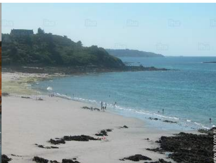
widok z domu