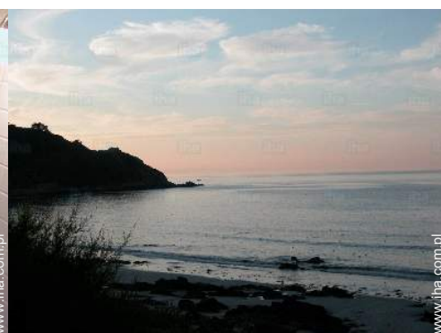
widok na zachód słońca