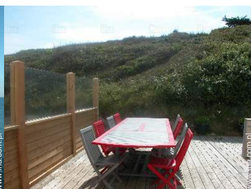
widok z kuchni