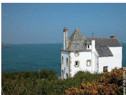
widok na morze