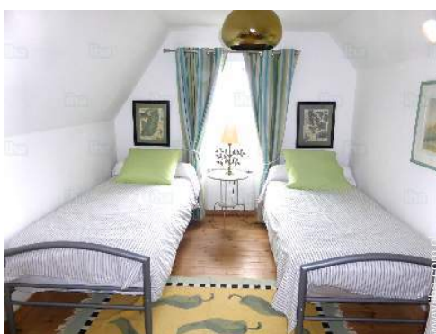
pokój dla dzieci