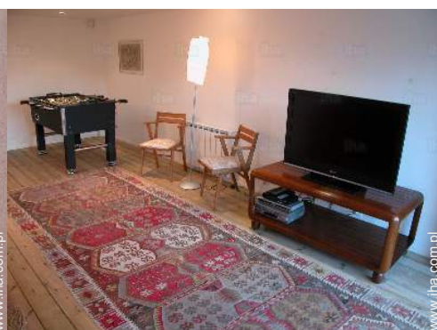
Udogodnienia dla rozrywki