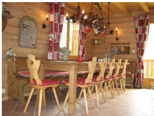
kaçik do jedzenia