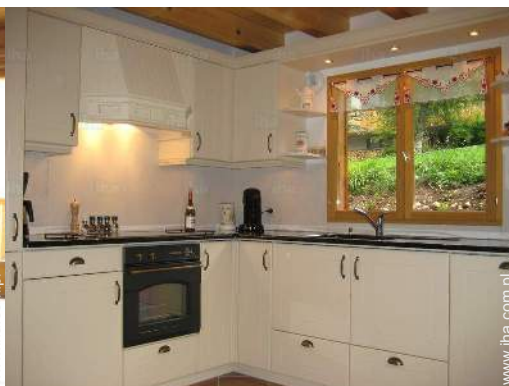
duża kuchnia amerykańska