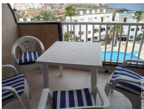
widok na basen