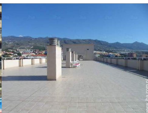
widok z tarasu