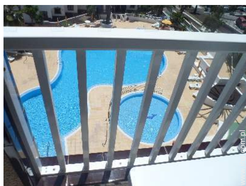
widok z tarasu