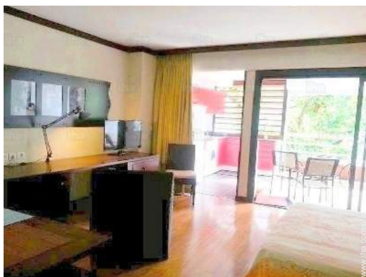
Wyposażenie jest do Państwa dyspozycji