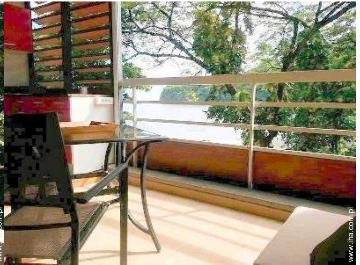
widok z mieszkania