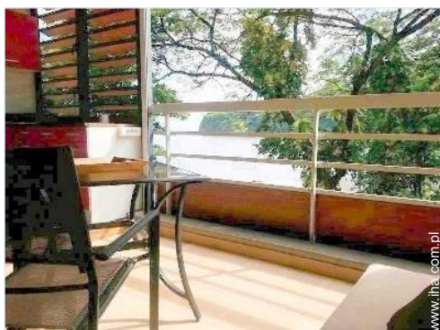
widok z mieszkania

Przywileje : Bezpośredni dostęp do plaży