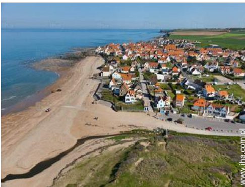
widok z lotu ptaka