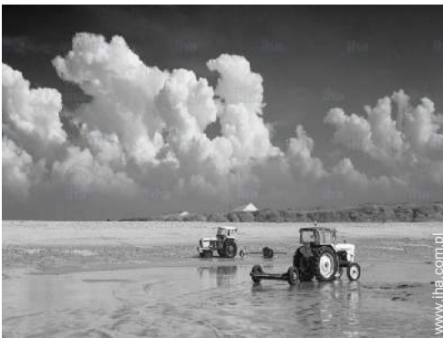
widok na morze