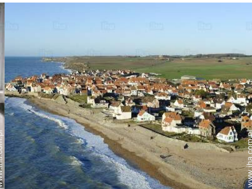
widok z lotu ptaka