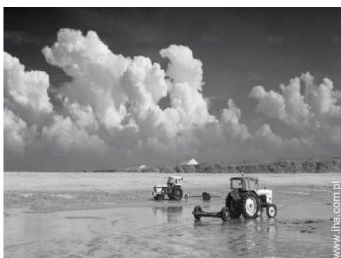
widok na morze