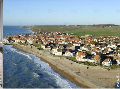
widok z lotu ptaka