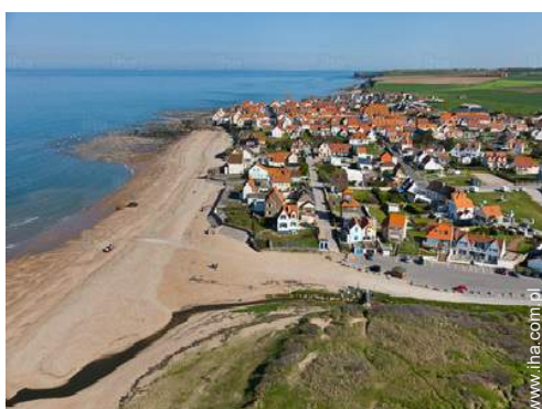
widok z lotu ptaka