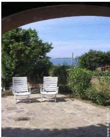
Środowisko do dyspozycji gości