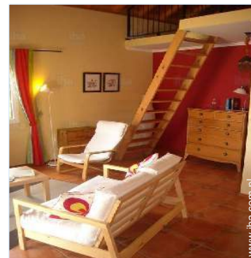
widok z pokoju wspólnego