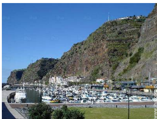
port dla statków wycieczkowych