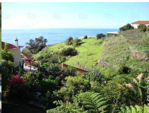
widok na ocean