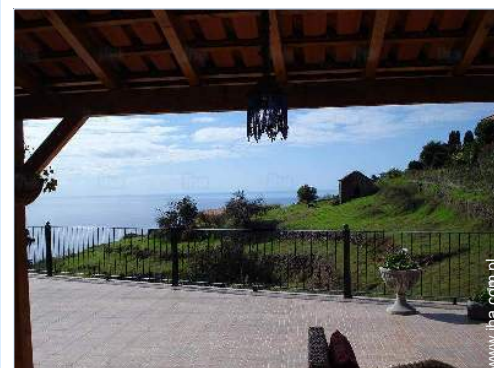
widok od południowego zachodu