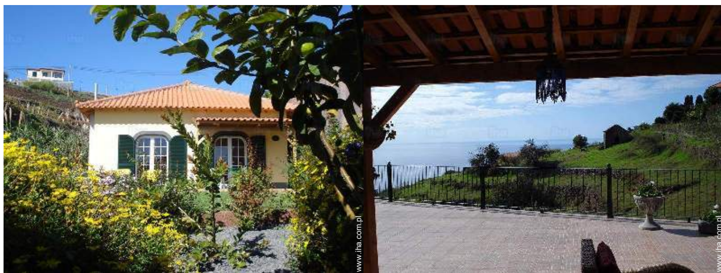
widok od południowego zachodu