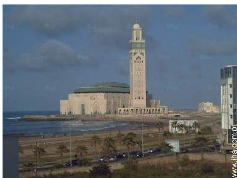
widok z mieszkania

Przywileje : Bezpośredni dostęp do plaży