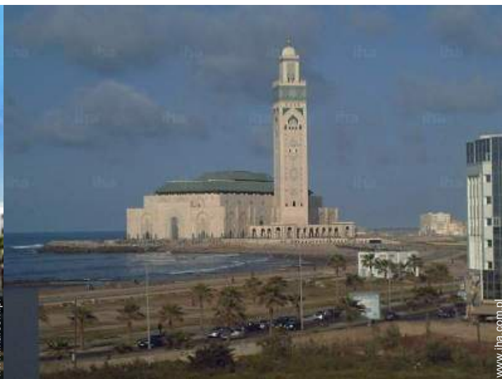
widok z mieszkania