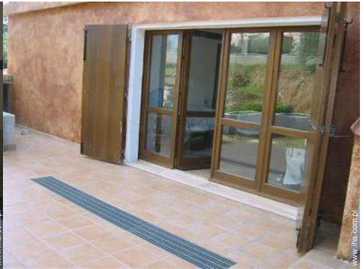
widok z werandy