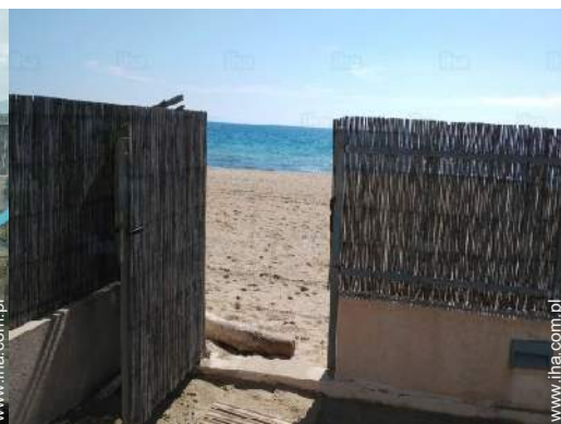
widok na morze