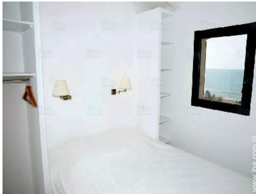
widok z pokoju