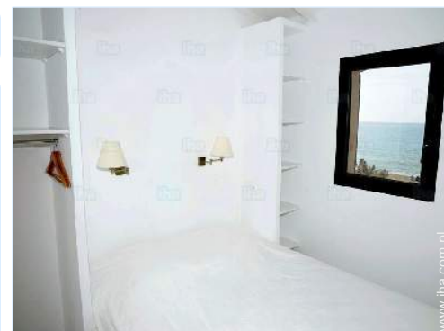
widok z pokoju

Salon letni, parasol, kącik ogrodowy, 2 leżak (i), prysznic pod gołym niebem