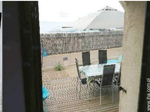
widok z pokoju