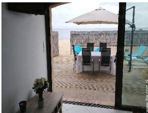
widok na dwór