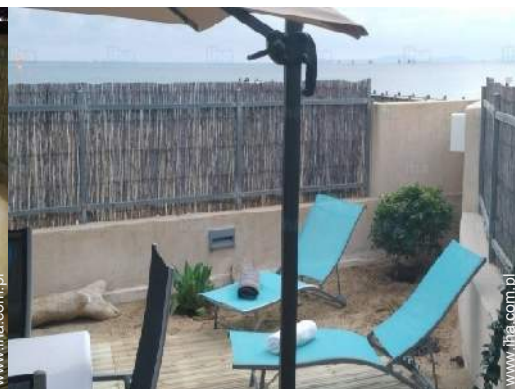
widok z ogrodu / parku