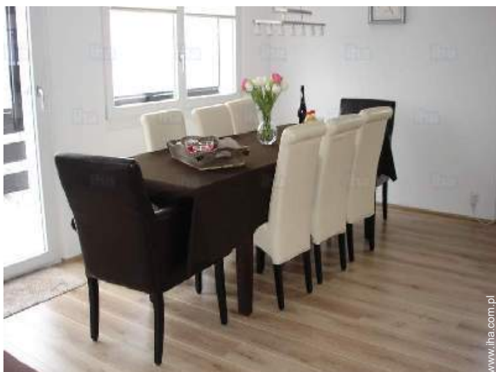
kąciok do jedzenia