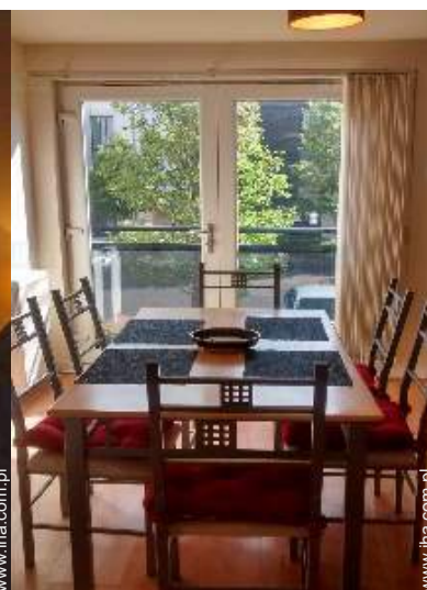
kąciok do jedzenia