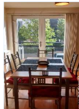
kącik do jedzenia