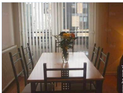
kącik do jedzenia