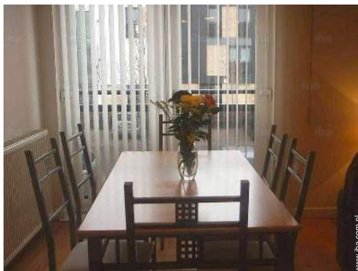
kąciok do jedzenia