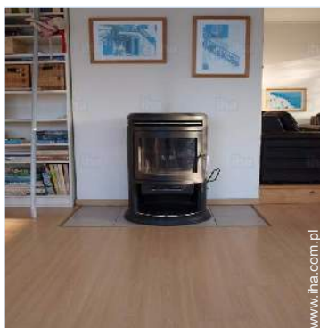
piec opalany drewnem