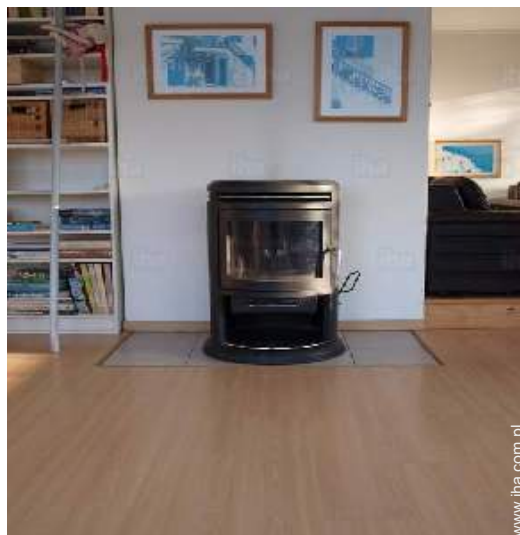
piec opalany drewnem