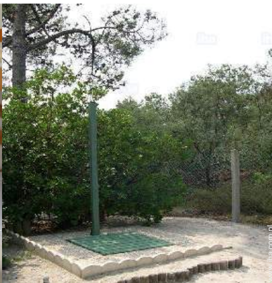
Wyposażenie jest do Państwa dyspozycji