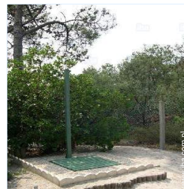
Wyposażenie jest do Państwa dyspozycji