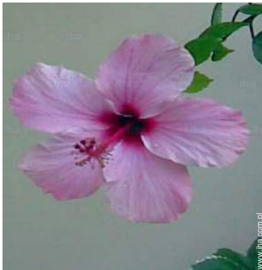
widok na ogród / park