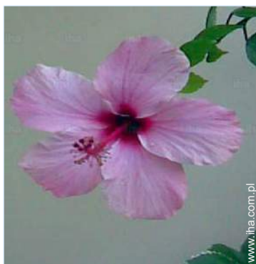
widok na ogród / park