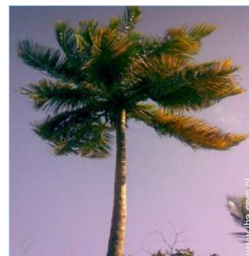
widok z ogrodu / parku

Centrum wsi 800m Śródmieście 3km Przystanek autobusowy 200m Wynajem okrętów 1km Piekarnia 200m Magazyny lokalne 500m Supermarket 800m Sklepy luksusowe 500m Fryzjer 500m Kafejka internetowa 500m Poczta 3km Bank 3km Apteka 800m Lekarz 1km Szpital 3km