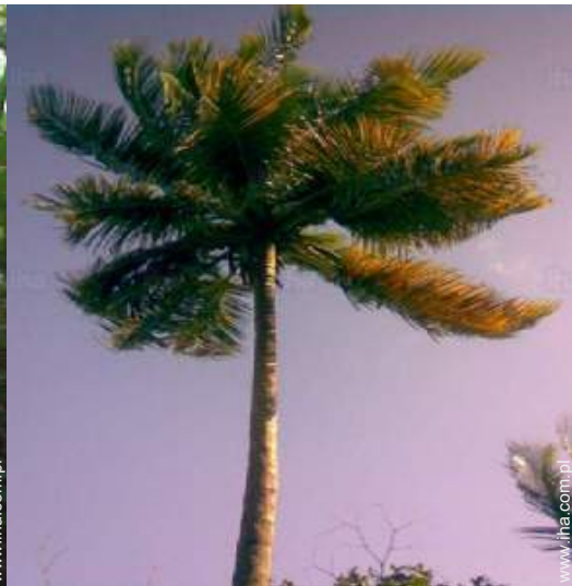
widok z ogrodu / parku