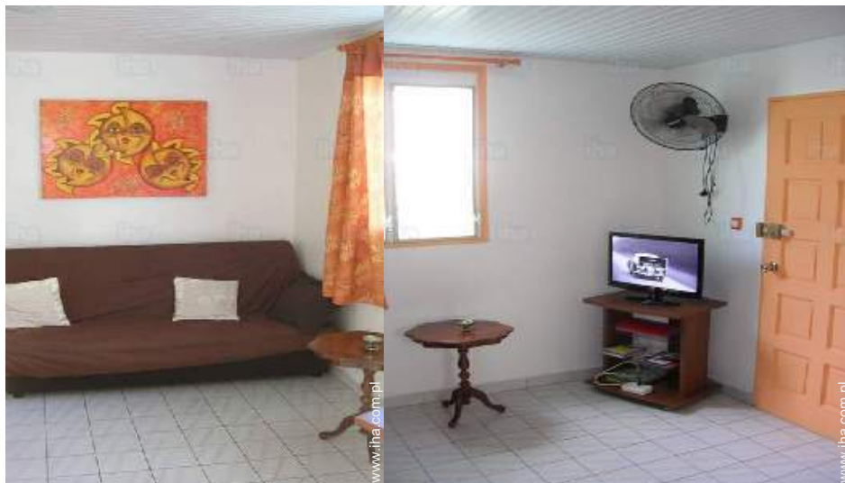
wersalka(i) 2 pers.