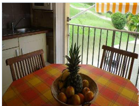
kącik do jedzenia