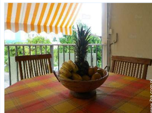
kącik do jedzenia