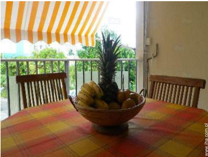
kącik do jedzenia