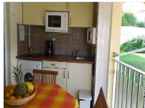
kącik do jedzenia