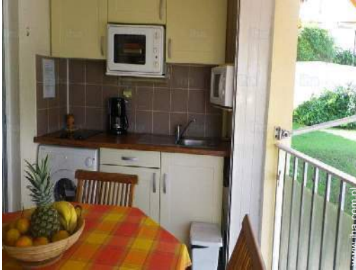
kącik do jedzenia