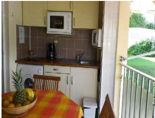
kącik do jedzenia