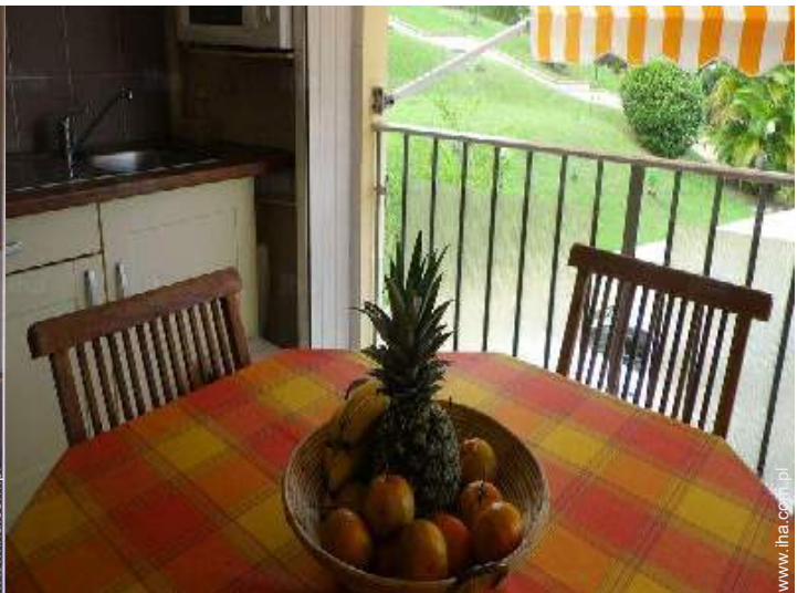
kącik do jedzenia