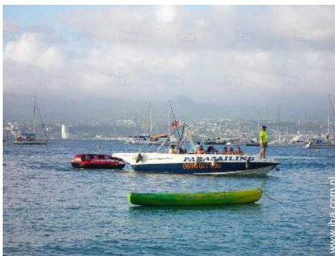
rozrywka żeglarska w pobliżu