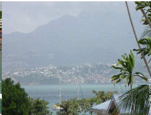
widok z mieszkania