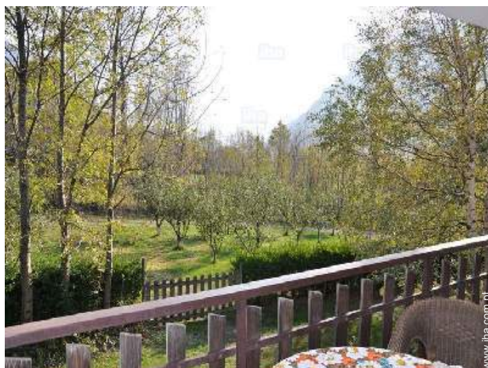
widok z zadaszonego tarasu