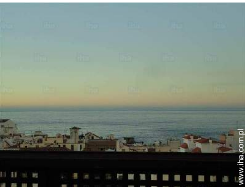
widok z tarasu