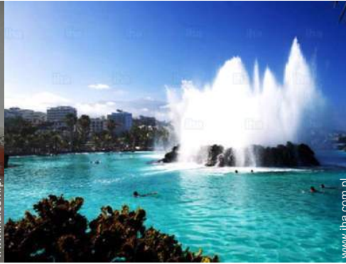
rozrywka kąpielowa w pobliżu