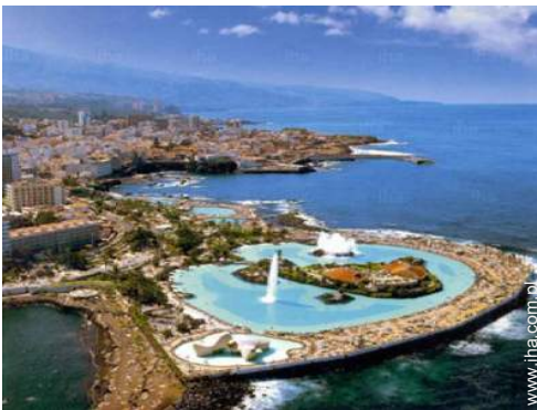
widok z lotu ptaka