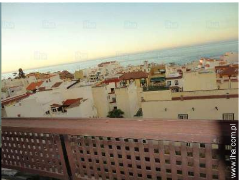
widok z mieszkania