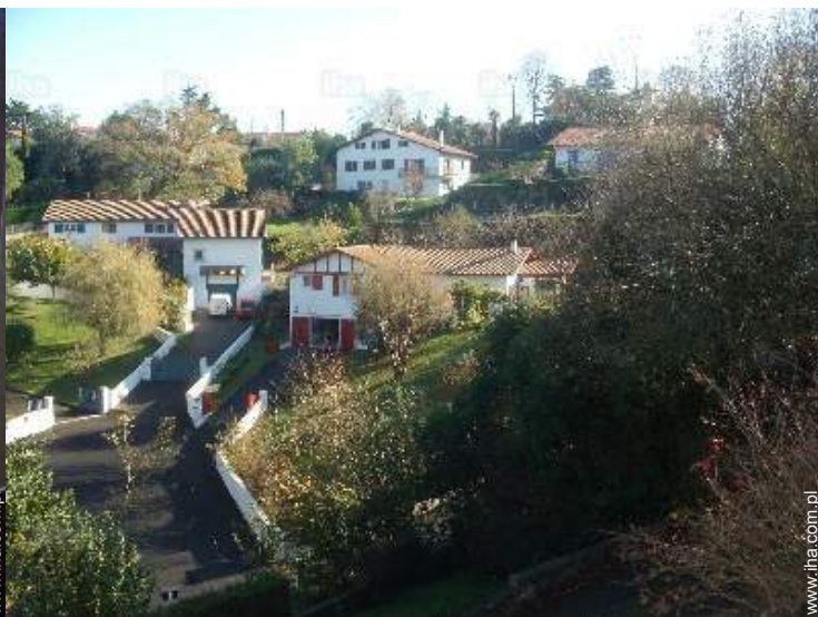
widok z mieszkania