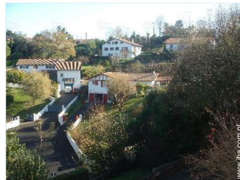
widok z mieszkania

Grill gazowy, Stół(y) ogrodowy(e), 4 krzesło(a) ogrodowe, parasol, kącik ogrodowy