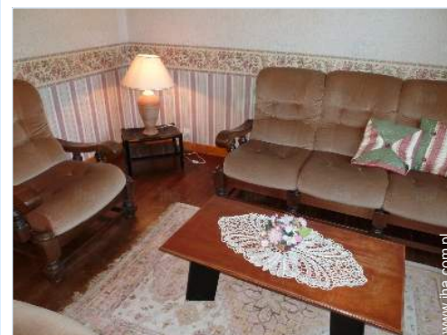
pokój z TV