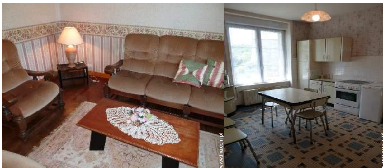
pokój z TV