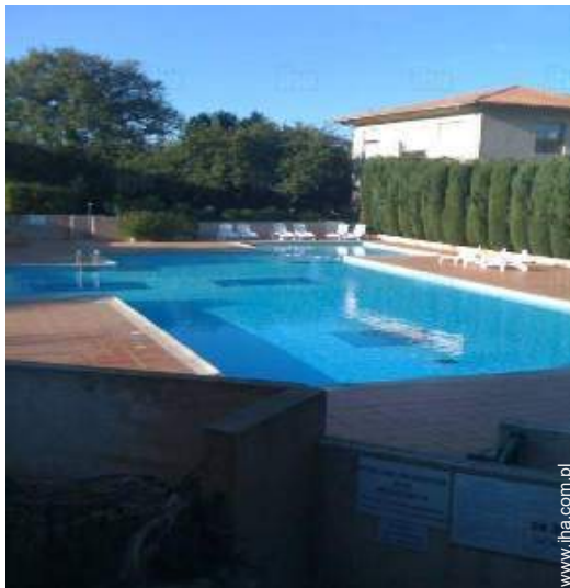
basen we właściwości