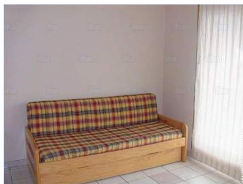
wersalka(i) 2 pers.