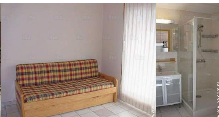
wersalka(i) 2 pers.