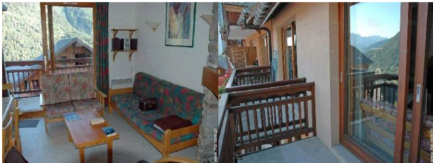
widok z balkonu