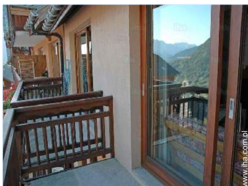
widok z balkonu