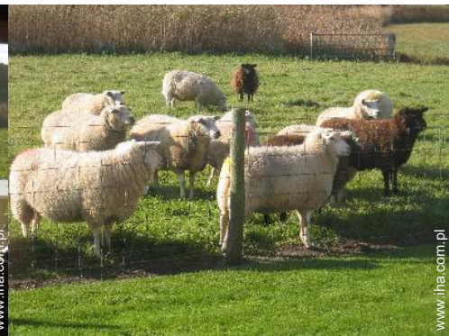
widok z domu