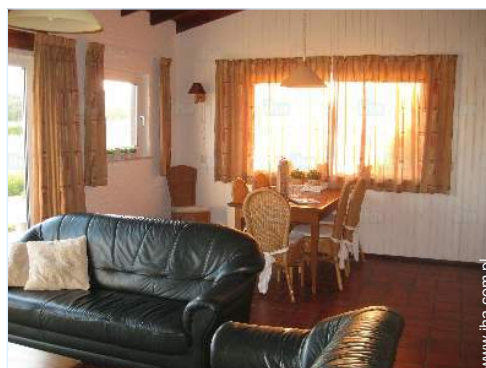
kącik do jedzenia