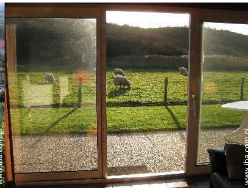
widok z domu