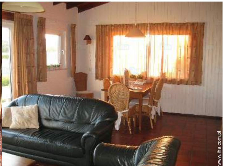
kącik do jedzenia