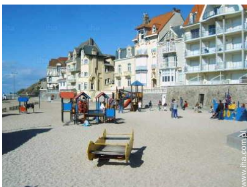
rozrywka w pobliżu