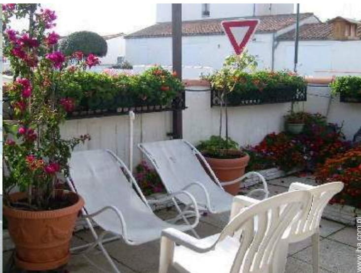
Urządzenia dostępne dla gości zewnętrzne