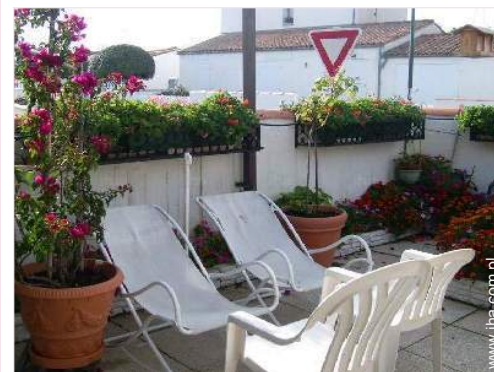
Urządzenia dostępne dla gości zewnętrzne